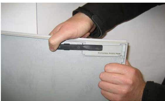
5. Kunststoffschieber wieder bis zur Arretierung einschieben