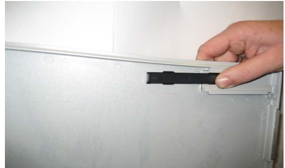
2. Kunststoffschieber ausschieben