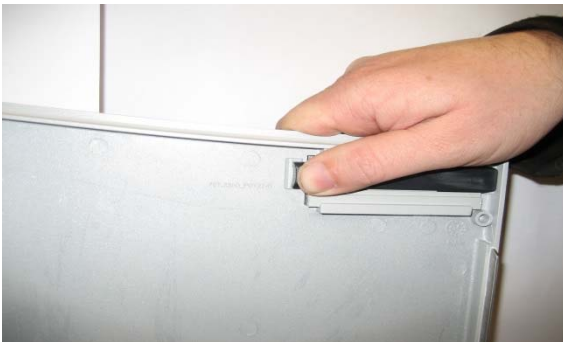
1. Paketfachtüre öffnen