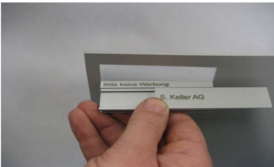
3. Schild ausschieben